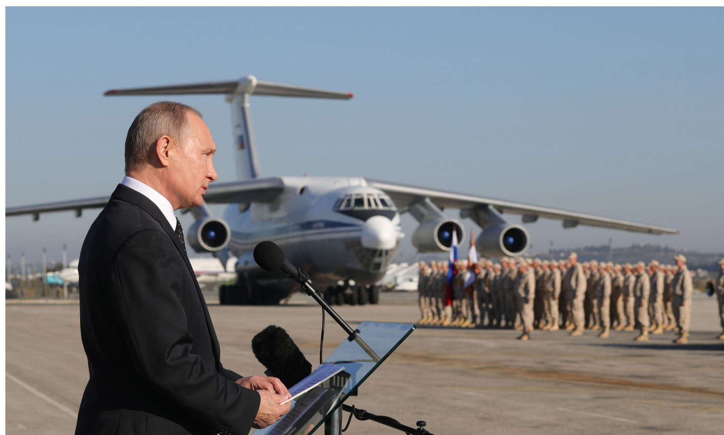
Mannen som overtok statsroret og som gjennom mer enn 17 år har festet et stadig sterkere grep om det, er ingen ideolog, skriver artikkelforfatteren om Vladimir Putin.

De skulle bli de forspilte muligheters epoke. Det var et vindu som ble lukket nyttårsaften 1999, da Jeltsin trakk seg tilbake og overlot styret til Vladimir Putin.