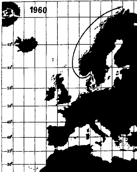
Sovjetiske marinefartøyer i åpent hav var i 1960 et ytterst sjeldent syn, bortsett fra sporadiske overføringer av enheter mellom Østersjøflåten og Nordsjøflåten.

Når det gjelder spørsmålet om håndteringen av våre nasjonale utfordringer i nordområdene, synes det å være bred enighet om at Norge ikke er tjent med å fremstå som en godfjott i det internasjonale selskap. I så henseende kan vi trolig trygt konstatere at vår nordpolitikk er - og vil fortsatt være - forankret i prinsippet om nøktern ivaretagelse av våre egne, nasjonale interesser, - interesser som selvsagt også omfatter forpliktende internasjonalt samarbeid tuftet på felles verdier og grenseoverskridende utfordringer.